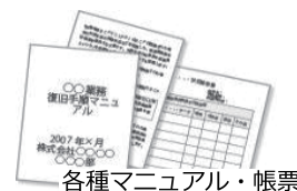
各種マニュアル・帳票