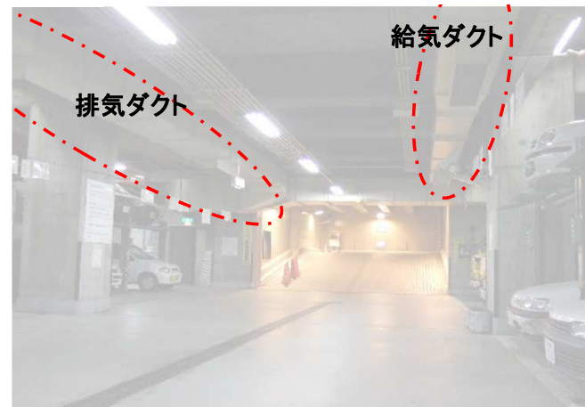
地下駐車場換気設備(例)