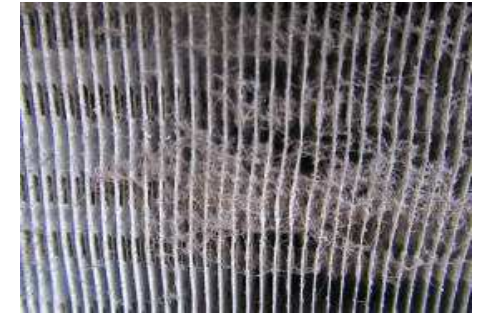
エアコン室外機の裏側の空気吸い込みフィン