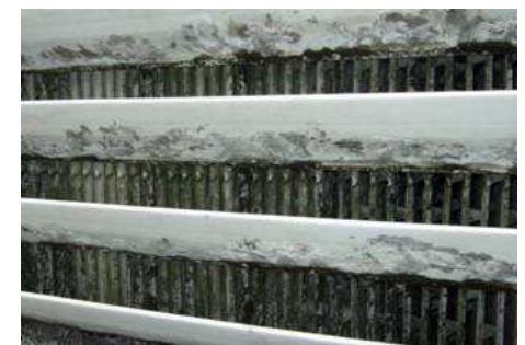
冷却塔充填材の汚れ