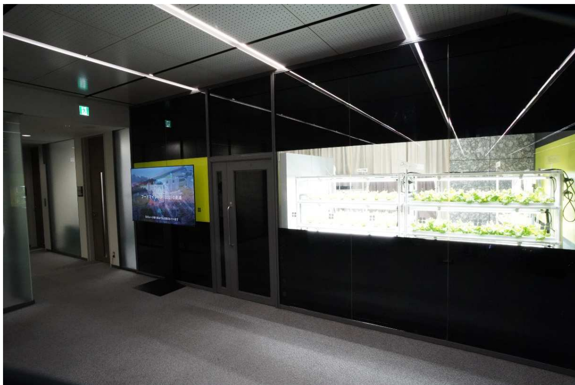
本店ビル2階 実証試験スペース