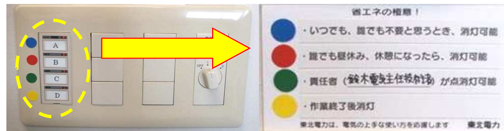
照明スイッチ色分けシール